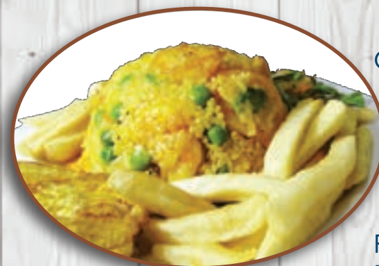
Arroz con camarón