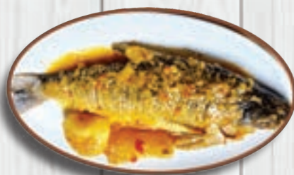
Viudo de Bocachico

* Pescados sudados, acompañados de arroz, papa, plátano, ensalada y consomé de la casa.