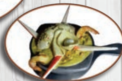
Cazuela de la casa Adición de Salsas